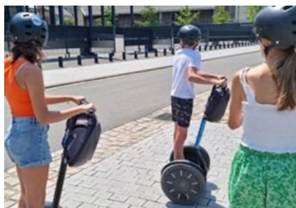
Séjour itinérant ados entre terre et mer de Pornic (44) à Poupet (85)