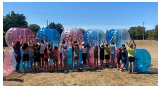
Bubble foot à Fontdouce (17)

Séjours, sorties, activités. Autant d'actions qui permettent de développer l'ouverture, l'esprit critique, la curiosité, la compréhension et la prise de décision du jeune.