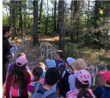
Retour au moyen âge à Longuenée-en-Ajou (49)

En plus des activités proposées au sein de l'accueil de loisirs, les enfants ont pu profiter de nombreuses sorties et de séjours à thèmes.