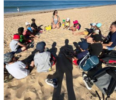
Natur'Océan à Saint-Hilaire-de-Riez (85)