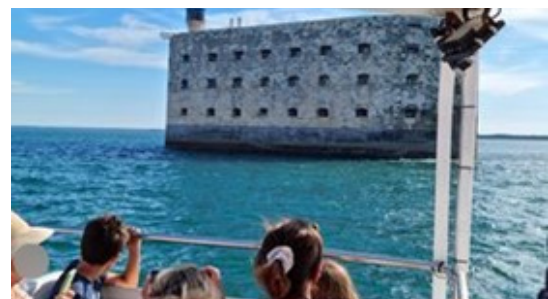
A la découverte des îles à Bourcefranc-le-Chapus (17)