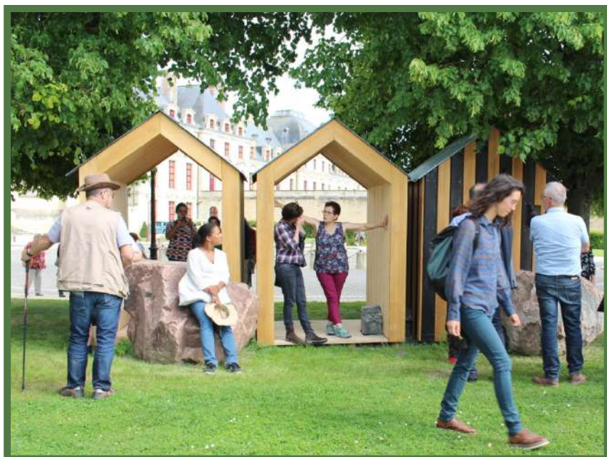
PHOTO : SOUVENIR D'UNE PLAGE, Mythologie d'un possible littoral – Cabines des remparts - © Ville de Thouars