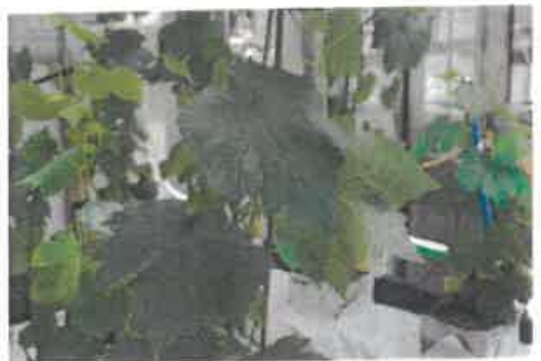
Ici, une photo prise 43 jours après le traitement par notre produit qui montre un reverdissement spectaculaire des feuilles