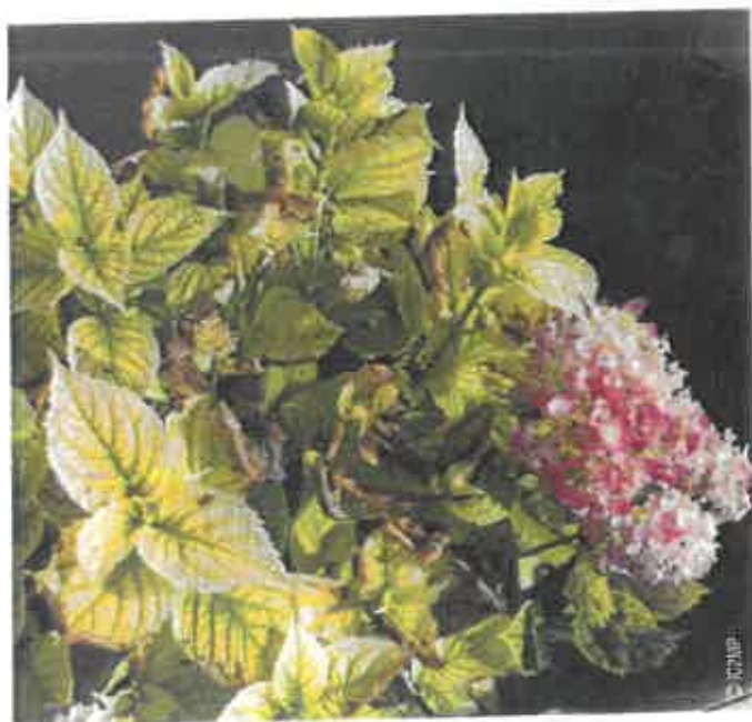
Un exemple de carence en fer : la chlorose de l'hortensia

Cependant, quel que soit l'élément considéré (macro, méso ou oligo-élément), c'est toujours l'élément déficient qui va impacter la croissance et le rendement de la plante. Ces carences peuvent être soit primaires, c'est-à-dire provoquées par une teneur insuffisante d'un élément dans le sol (conséquences de l'agriculture intensive), soit induites, c'est-à-