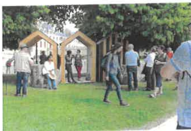
PHOTO : SOUVENIR D'UNE PLAGE , Mythologie d'un possible littoral – Cabines des remparts

Afin de permettre aux promeneurs de voir le Thouet autrement, le SMVT a souhaité valoriser les abords de la rivière à travers l'installation d'œuvres d'art pérennes. Dans le cadre du programme de commande publique du ministère de la Culture et avec l'accompagnement du centre d'art la Chapelle Jeanne d'Arc de Thouars, trois œuvres ont été réalisées en 2019 à travers la création de Corène CAUBEL « SOUVENIR D'UNE PLAGE : Mythologie d'un possible littoral » sur les communes de Thouars, Saint-Jean-de-Thouars et Saint-Jacques-de-Thouars.