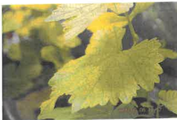
Feuilles de vigne (sauvignon) cultivée en serre et carencée artificiellement en fer

Pour nous contacter : Françoise Rocher, Plantalys SAS, 6 rue du Château, 79390 Doux ; contact@plantalys.fr