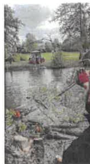
PHOTO : Base de Loisirs PARTHENAY

En complément, la Ville de Parthenay a pris en charge le retrait des peupliers d'Italie et l'émondage de frênes au cœur des îlots. Les arbres retirés ont été broyés puis valorisés par le prestataire en bois énergie. Le coût total de l'opération s'est élevé à 13 200 TTC pris en charge par le SMVT à hauteur de 8 640 euros et subventionné de 60% par l'Agence de l'eau Loire-Bretagne.