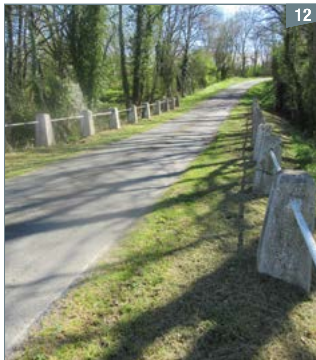
Le pont situé entre la Petite Roche et la Rairie marque également la limite entre les communes de Pompaire et de la Chapelle-Bertrand.

À la Petite Orgère, il prend le nom de Gerson qui se jette dans le Thouet à proximité de la Barangerie.