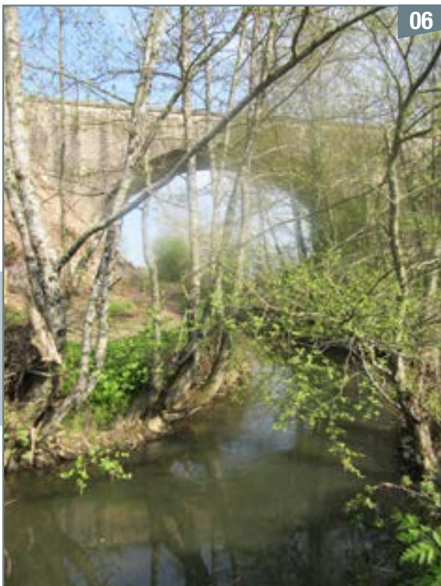
La voie ferrée Parthenay-Niort franchit la Viette sur le pont de la Chaboissière

Un peu plus loin, la rivière décrit de jolis méandres, trace son lit dans la vallée, sous le regard dominateur du logis de Plessy-Viette de Chaumusson. Elle coule sous le pont de la Chaboissière qui permet le passage de la ligne de chemin de fer Parthenay-Niort (photo 6).