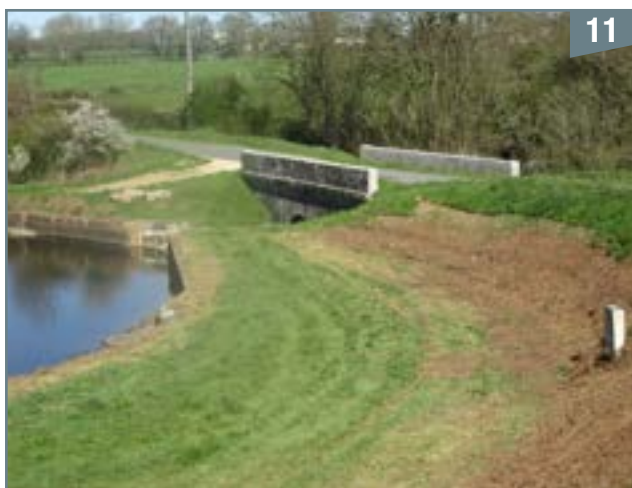
Le pont de l'étang situé en bas du bois de la Roulière permet le passage sur la route D176 reliant Parthenay à Vausseroux et marque la limite entre les communes de Pompaire et de la Chapelle-Bertrand

Après un passage sous le pont reliant Vausseroux à Parthenay (photo 11), le cours d'eau s'aventure à travers roseaux, arbustes et broussailles dans une belle vallée en contrebas du village du Chêne.