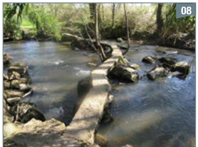
Le gué du Rézard, passage bien connu des randonneurs entre Le Tallud et Pompaire