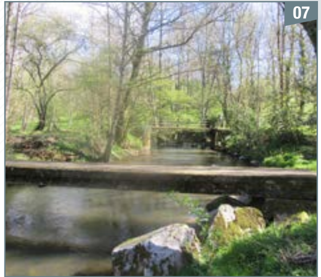
La passerelle de Pont-Soutain permet le passage des piétons au-dessus de la Viette. À l'arrière-plan, un ancien pont privé

La Viette serpente ensuite à proximité de la Guinauzière, coule sous la passerelle de Pont-Soutain (photo 7), puis après une large courbe, arrive au gué du Rézard (point D, photo 8). Il ne lui reste plus qu'à rejoindre le pont de la Logette et de se jeter dans le Thouet à Parthenay après avoir parcouru 16,3 km.