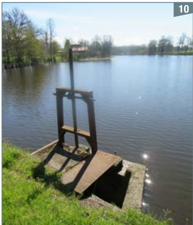
À la sortie de l'étang de la Roulière, l'eau s'écoule sous la chaussée, puis traverse la pêcherie

Retour au point A où nous retrouvons le ruisseau de la Crolée qui s'écoule, à l'est des villages de Monchéré et de l'Abeille jusqu'à l'étang de la Roulière (photo 10). Ce ruisseau, qui coule au milieu de ce magnifique étang, délimite les communes de Pompaire et de la Chapelle-Bertrand.