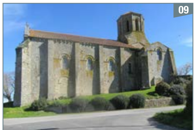
La jonction de ces 2 routes devant l'église Saint-Pierre de Parthenay-le-Vieux marque la limite entre Parthenay et Pompaire

Alimenté par un ru descendant des champs en amont, ce cours d'eau poursuit la limite avec la commune de Parthenay. Il s'écoule entre la Sutière (Pompaire) et la Rambaudière (Parthenay) et rejoint le champ où se trouvait la queue de l'étang de l'Orgère (point E).