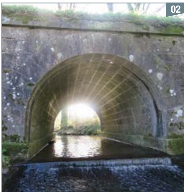
À sa sortie de l'étang de Chienmort, le cours d'eau passe sous le pont reliant Beaulieu à Parthenay

À la sortie de l'étang, il s'écoule sous le pont de la route D142 reliant Beaulieu à Parthenay (photo 2) et se jette dans la Viette (point B, photo 3) en contrebas du village Viette, le bien nommé.