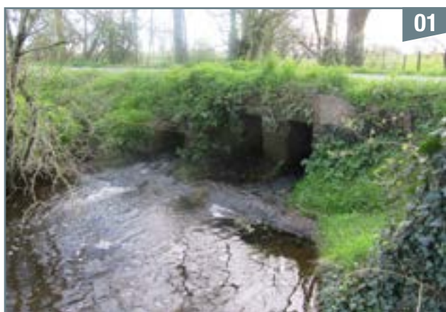
Le ruisseau de la Crolée, à son passage sous la route reliant la Binochère à La Touche-Ory

Notre départ se situe au point A situé sur la route D165, là où celle-ci franchit le ruisseau de la Crolée (photo 1). Cette route, qui dessert le village de la Binochère, puis coupe la D938 reliant Parthenay à Saint-Maixent, constitue la limite avec Beaulieu jusqu'au sud du village de la Fricaudière. La fontaine de ce village alimente un ruisseau qui continue la limite entre les deux communes.