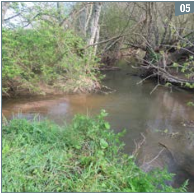
Le ruisseau de La Martinière (à gauche) se jette ici dans la Viette (à droite). Il fixe la limite des 3 communes : Soutiers, Le Tallud et Pompaire

Après un cours sinueux imposé par la colline de la Veillerie, elle reçoit sur sa rive gauche le ruisseau de la Martinière qui marque la fin de la limite entre Soutiers et Pompaire (point C, photo 5).