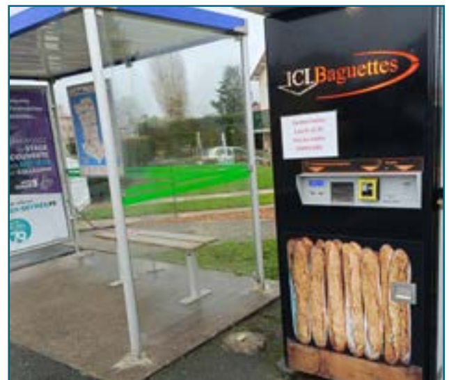
Notre distributeur à retrouvé son abri de bus !

En cas de panne, un numéro de téléphone affiché sur le distributeur. N'hésitez pas à téléphoner : la boulangerie intervient dans la journée.