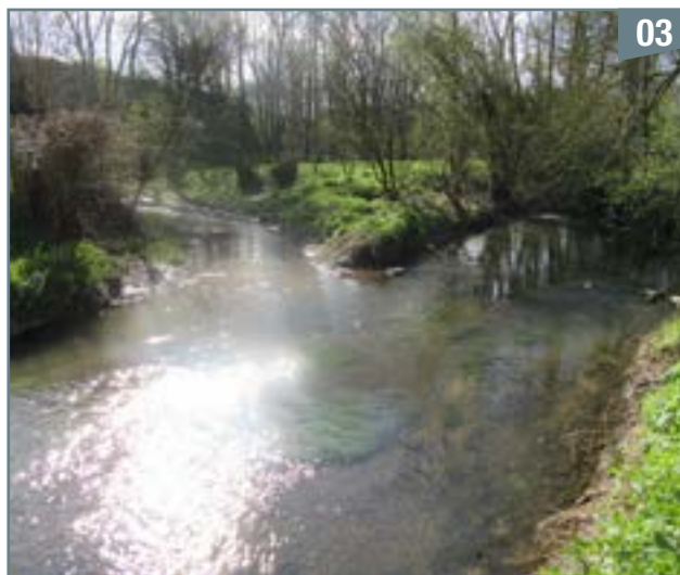
Confluence du cours d'eau né à la Fricaudière (à gauche) et de la Viette (à droite)