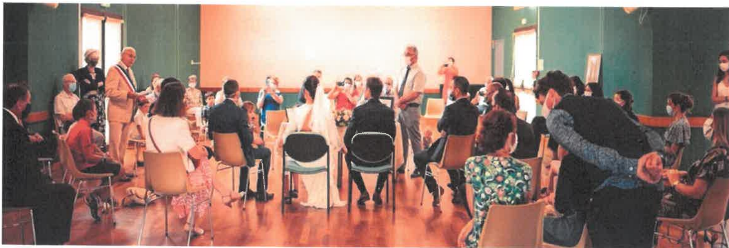
La vie continue malgré le Covid : mariage masqué et distances respectées dans la salle des fêtes de Saurais