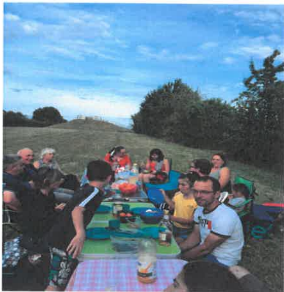
Petite tablée, mais bon goûter au Terrier le 14 juillet