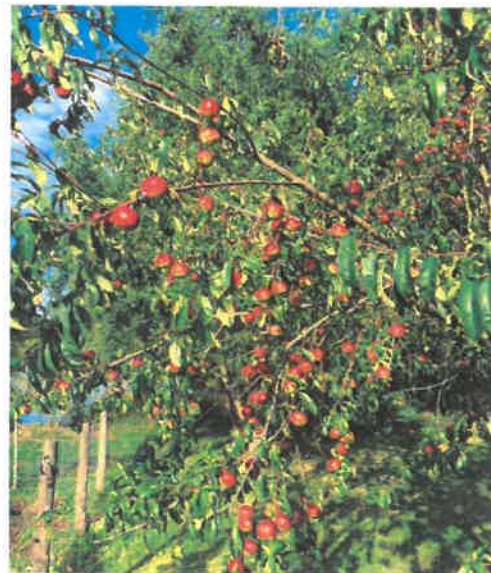
Quand les brugnons se dorment à en rougir au soleil de Saurais...