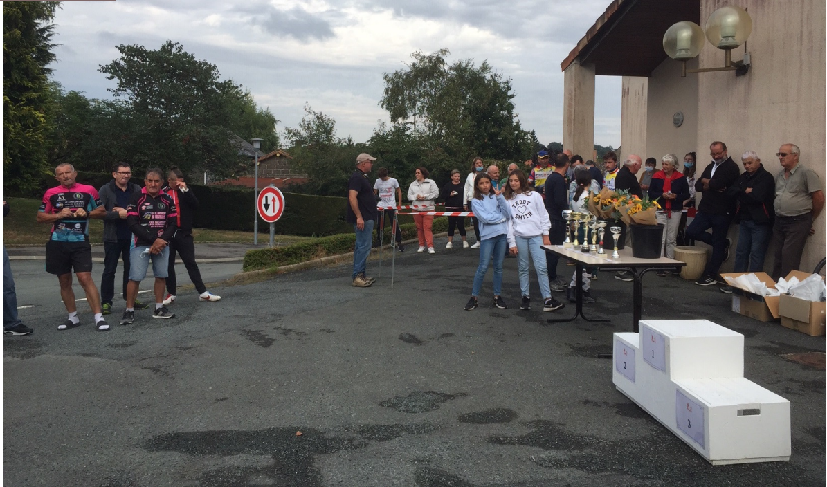
Avant la distribution des prix et les montées sur le podium, c'est l'attente du public devant la salle des fêtes