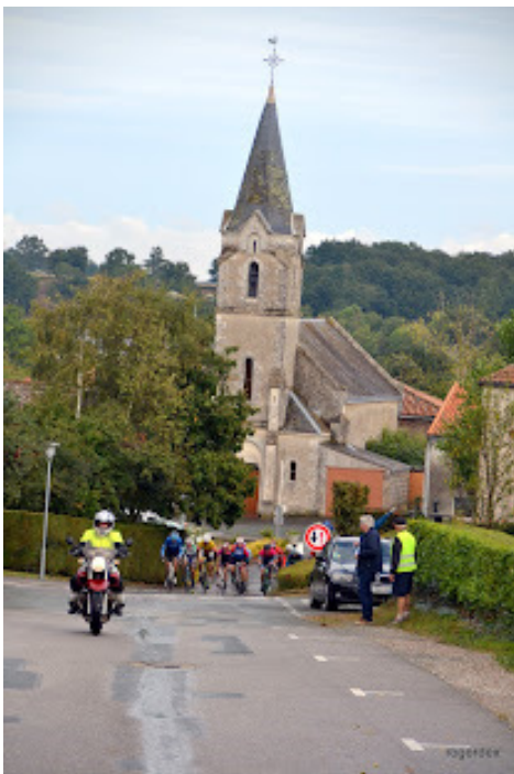
En plein effort dans la petite côte rue des Charmilles, avant la ligne d'arrivée ..