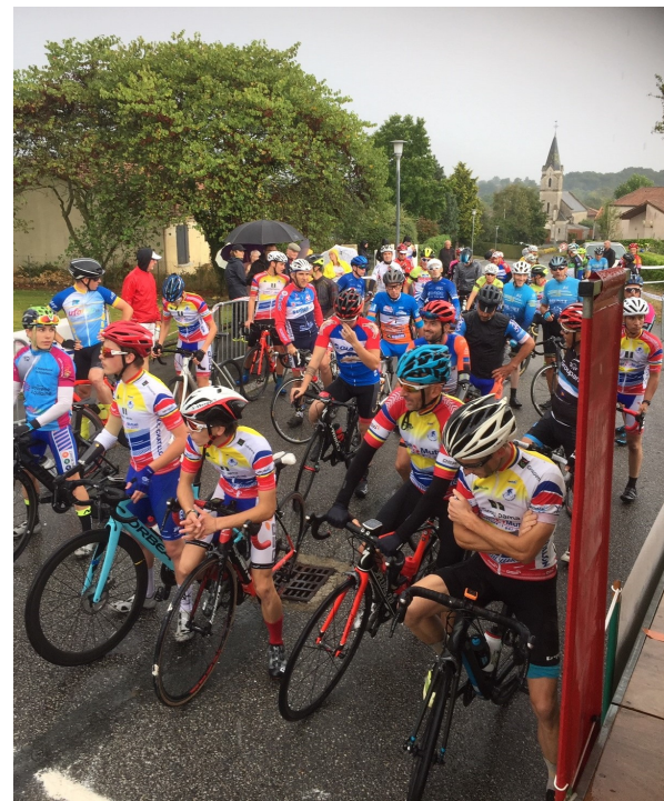
Avant l'effort, c'est l'heure du départ

Après de longs mois d'inactivités associatives, le Vélo Club Chatillonnais, avec la commune de Saurais et l'association La Sauraisienne ont préparé et organisé un après-midi de courses cyclistes par catégories dans le cadre du championnat UFOLEP 79. C'est le samedi après-midi 25 septembre que ce sont déroulées ces courses sur un circuit d'environ 6 km tracé sur les routes de Saurais. La météo instable autour de midi a été plus clémente l'après-midi, permettant ainsi aux coureurs de participer dans de bonnes conditions de sécurité. Des signaleurs et signaleuses étaient postés à chaque carrefour pour guider les automobilistes dans le sens de la course, et s'assurant qu'aucun véhicule ne remonte la course à contre-sens. Un arrêté municipal validé par la Préfecture autorisait cette mise en place. Les dirigeants du V.C.C. et les coureurs ont apprécié l'organisation globale et particulièrement les aménagements sécuritaires mis en place par la commune avec les bénévoles de La Sauraisienne. Un grand MERCI à celles et ceux qui ont participé activement à l'organisation de ce temps sportif et festif. Ce sont ces temps de participation à une œuvre collective qui créent du lien entre les gens, qui permettent de mieux se connaître et qui assurent la cohésion sociale de notre petite commune rurale ... MERCI aux dirigeants du VCC d'avoir choisi SAURAIS .