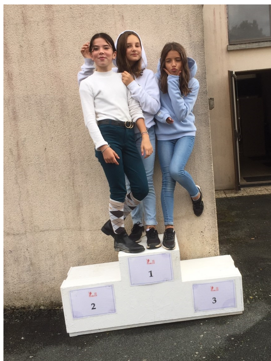
Peut-être des futures championnes de cyclisme ?? ...

Après de longs mois d'inactivités associatives, le Vélo Club Chatillonnais, avec la commune de Saurais et l'association La Sauraisienne ont préparé et organisé un après-midi de courses cyclistes par catégories dans le cadre du championnat UFOLEP 79. C'est le samedi après-midi 25 septembre que ce sont déroulées ces courses sur un circuit d'environ 6 km tracé sur les routes de Saurais. La météo instable autour de midi a été plus clémente l'après-midi, permettant ainsi aux coureurs de participer dans de bonnes conditions de sécurité. Des signaleurs et signaleuses étaient postés à chaque carrefour pour guider les automobilistes dans le sens de la course, et s'assurant qu'aucun véhicule ne remonte la course à contre-sens. Un arrêté municipal validé par la Préfecture autorisait cette mise en place. Les dirigeants du V.C.C. et les coureurs ont apprécié l'organisation globale et particulièrement les aménagements sécuritaires mis en place par la commune avec les bénévoles de La Sauraisienne. Un grand MERCI à celles et ceux qui ont participé activement à l'organisation de ce temps sportif et festif. Ce sont ces temps de participation à une œuvre collective qui créent du lien entre les gens, qui permettent de mieux se connaître et qui assurent la cohésion sociale de notre petite commune rurale ... MERCI aux dirigeants du VCC d'avoir choisi SAURAIS .