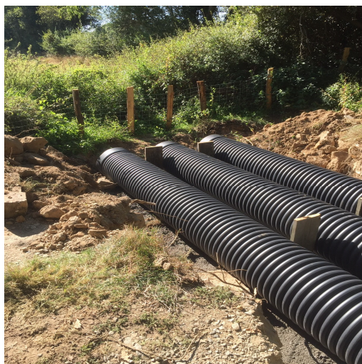
Nouvelles buses dans le chemin de la Bazonnaire vers La Peyratte