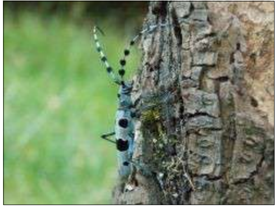
La Rosalie des Alpes a déjà été observée à Saurais ...

Le Syndicat Mixte de la Vallée du Thouet , dans le cadre de l'animation du site Natura 2000 « Bassin du Thouet amont », lance à nouveau cette année, un inventaire participatif de la Rosalie des Alpes. La Rosalie des Alpes est un Coléoptère allongé de grande taille (2 à 4 cm de l'avant de la tête au bout des ailes). Elle est facilement reconnaissable avec son aspect bleu velouté, ses 6 grandes taches noires et de très grandes antennes. Très discrète, les adultes sont actifs qu'entre fin juin et fin août suivant les années. La période est brève et c'est le seul moment où vous pourrez l'observer. Les milieux favorables à l'espèce, dans le bocage, sont les arbres creux et les arbres à têtard le long des haies ou encore les tas de bois coupés. Elle est peut-être dans votre jardin ! Partez à sa rencontre le long des chemins et faites nous part de vos observations. Votre aide nous sera très précieuse pour mieux connaître cet insecte rare. Transmettez-nous vos données sans plus attendre à l'adresse suivante : natura2000@valleedouthouet.fr ou sur le site http://www.nature79.org Inventaire participatif de la Rosalie des Alpes N.B : La Rosalie des Alpes est protégée en France ainsi que dans la plupart des pays d'Europe. Sa capture et sa détention ne sont pas autorisées !