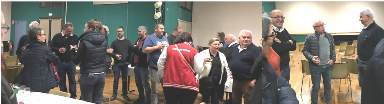
A l'occasion de la cérémonie des vœux à la salle des fêtes, le vendredi 5 janvier, ce fut encore l'occasion d'échanges entre habitants de Saurais. La convivialité est la base du « vivre ensemble » dans nos communes rurales ...