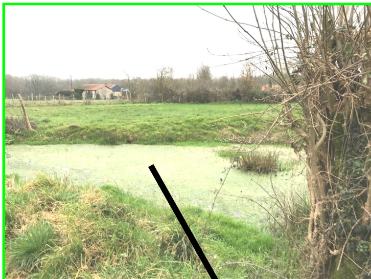
Mare communale à La Barre, entretenue par le voisinage