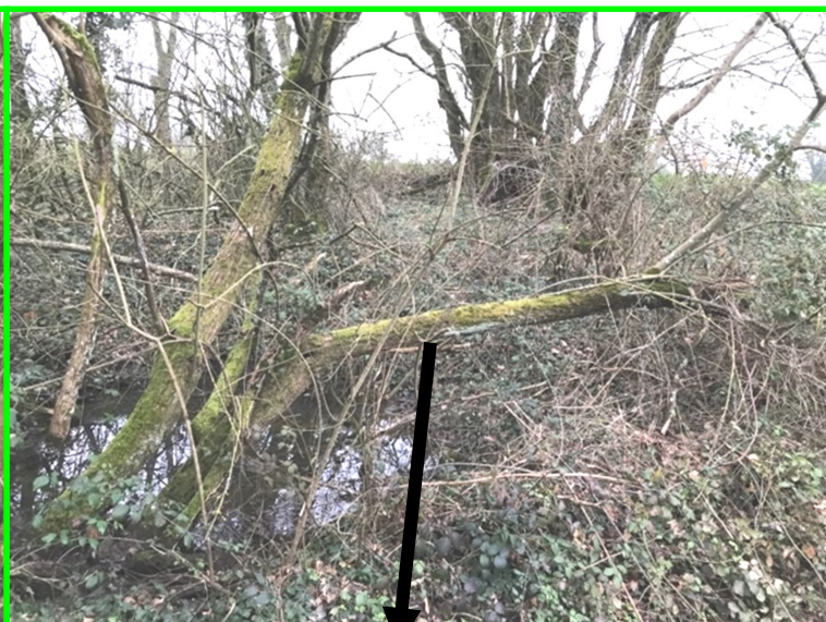
Mare communale située au bord du chemin de randonnée de La Barre vers St Martin du Fouilloux, à l'angle d'un petit chemin. Des arbres et branchages sont à dégager ... chantier à venir !