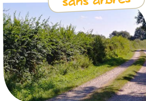
Haies basses sans arbres