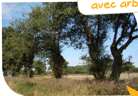
Haies basses avec arbres

Élaboration d'un programme d'actions en faveur des continuités écologiques et amorce de sa mise en oeuvre.