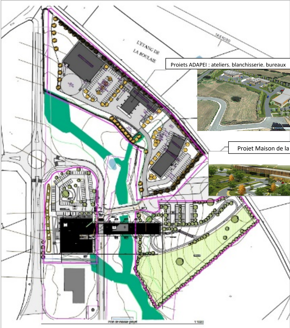
Projets ADAPEI : ateliers. blanchisserie. bureaux