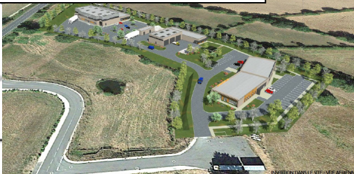
Projet Maison de la Parthenaise